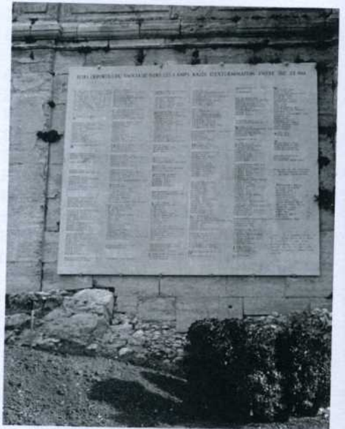
Plaquette commémorative des juifs déportés du Vaucluse - Rocher des Doms Avignon (Vaucluse)

N'oublions pas les nombreux internés juifs du Vaucluse qui ont eu la chance de survivre dans les camps français, notamment Drancy, Gurs, Les Milles, Rivesaltes, ainsi que ceux qui se sont échappés des trains les conduisant à la déportation.