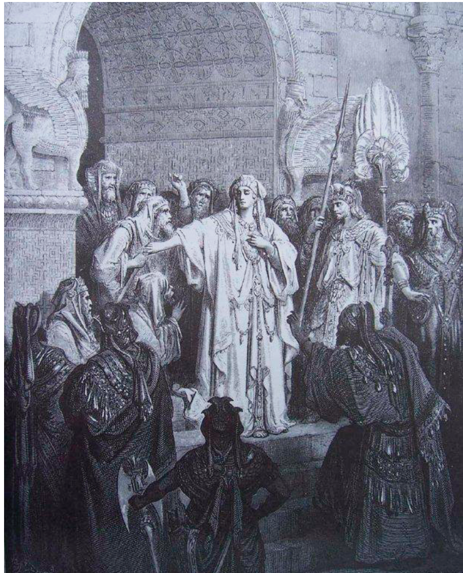
La reine Vasthi refusant d'obéir aux ordres d'Assuérus Gustave Doré(Bible de Gustave Doré)

«Je veux mettre dans ce vino oune bonne médecine» 42 Certains y voient une pratique italienne 43 , c'est tout à fait possible. Mais le poison figure dans le cauchemar du roi 44 . «Ces gens ne sont pas trop sages [...] j'ai compris