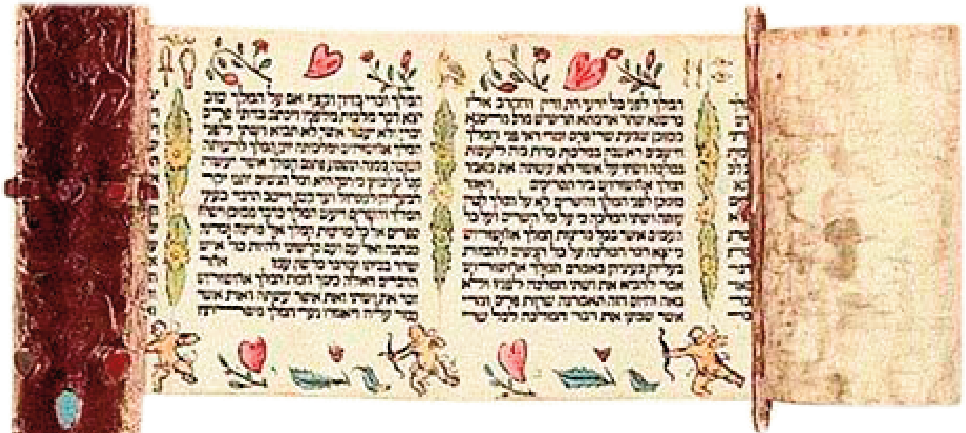
Megillah d'Esther

P ourim, le jour où «les sorts» sont décidés 1 tient une place toute particulière dans l'imaginaire du peuple juif. Pourim , c'est la fête 2 , la fête du déguisement, du carnaval, du défilement 3 Pourim , c'est l'histoire d'Esther qui raconte dans les moindres détails le récit d'un génocide planifié — il devait se dérouler le 13 du mois d' Adar 4 dans tous les états du roi Assuérus — et la façon dont le peuple d'Israël en exil réussit à en sortir indemne. L'origine de cette histoire est loin d'être claire L'his-