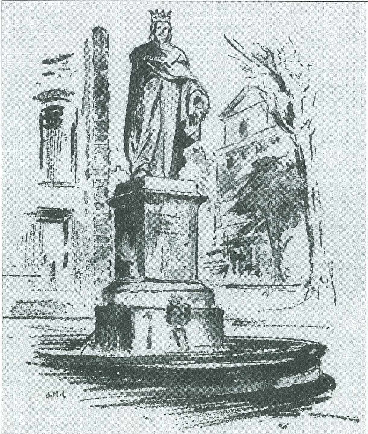
Aix-en-Provence : Statue du Roy René D'après le dessin original de J. M. LOUSTAUNAU